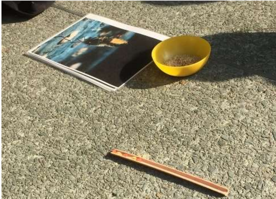
September: Wir erfahren, wie mühsam Wildbienen die Brutkammern anlegen.