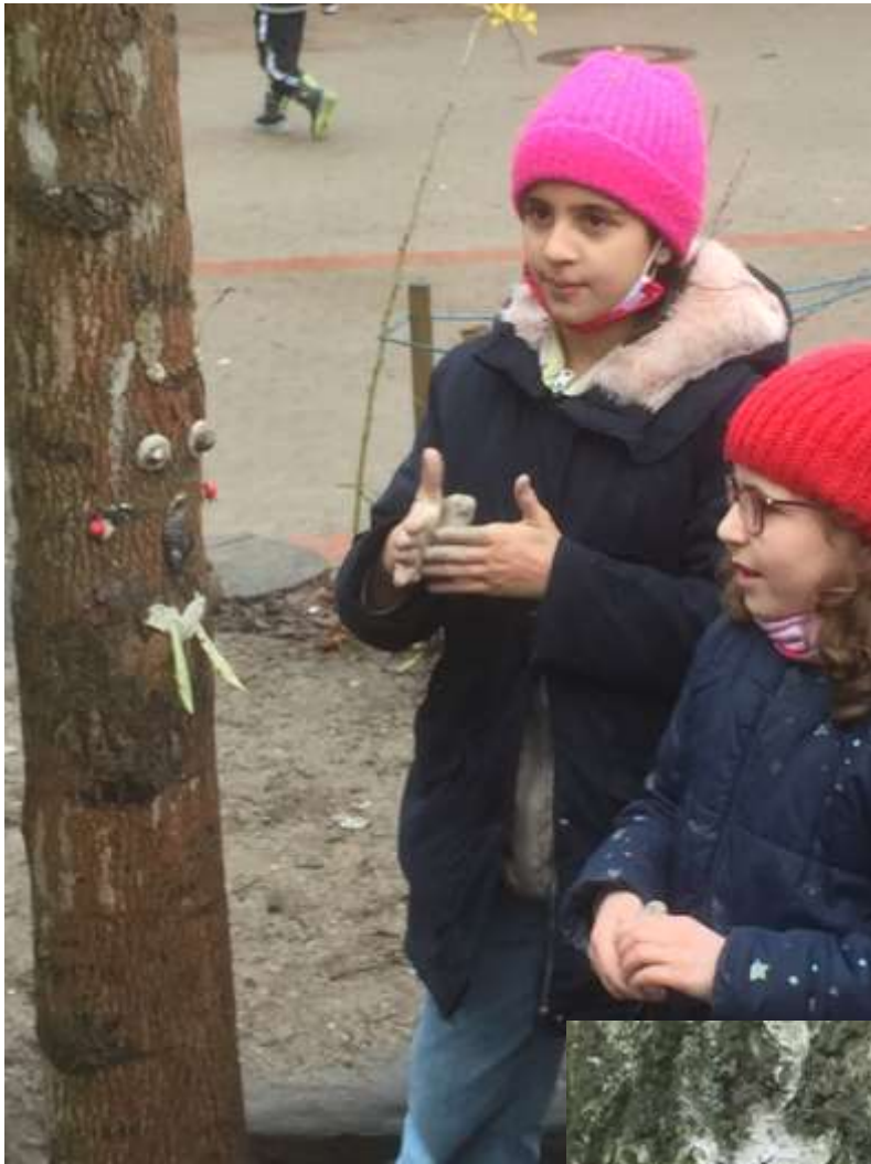
Corona bedingtes Ende der Draußenschule im Dezember: Kunst mit Naturmaterialien