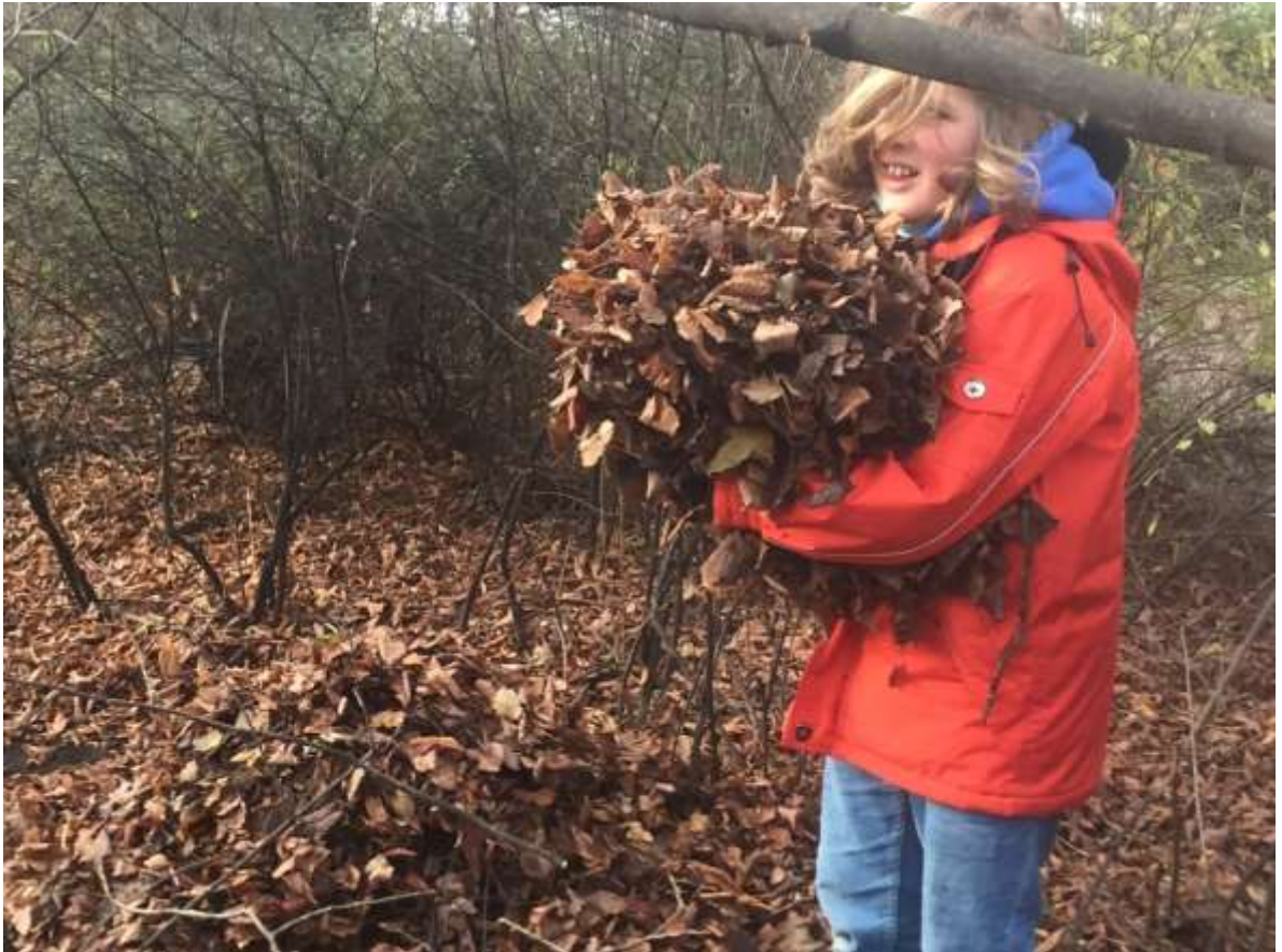
Dezember: Wir simulieren Überwinterungsstrategien im Schanzenpark.