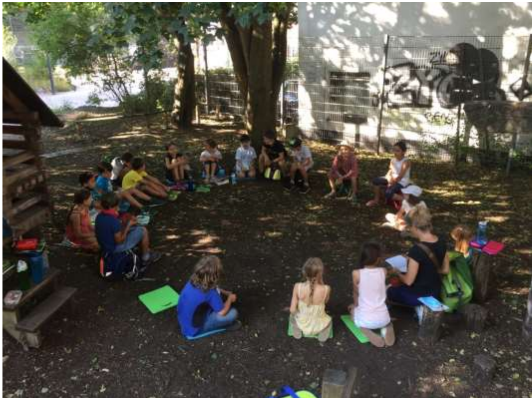
Corona bedingter Beginn der Draußenschule im August 2020